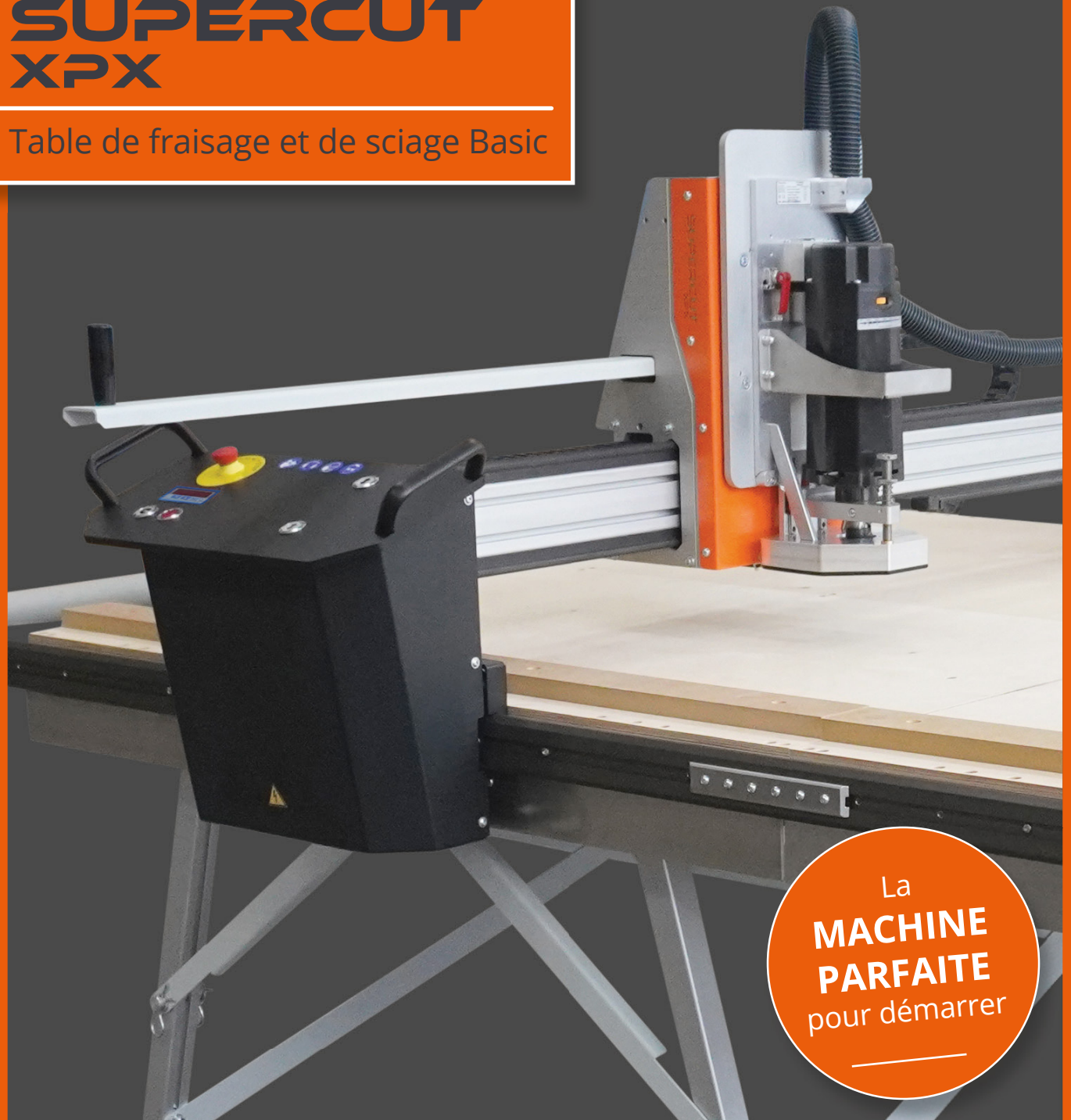
Table de fraisage et de sciage Basic