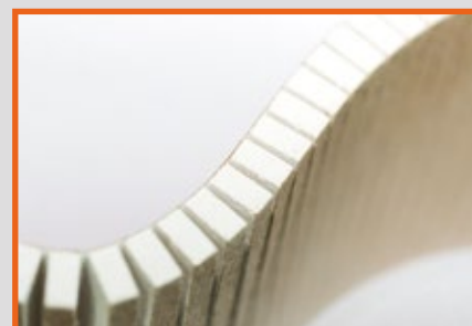
Peças moldadas tridimensionais