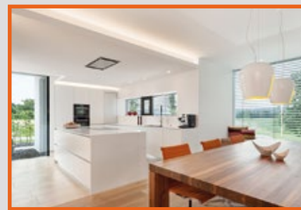
Melhores resultados de projeto