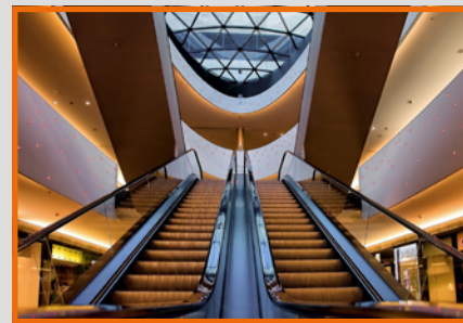
Melhores resultados de projeto