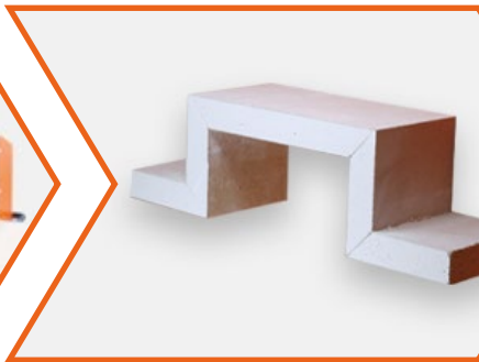
Produção de moldagem simples