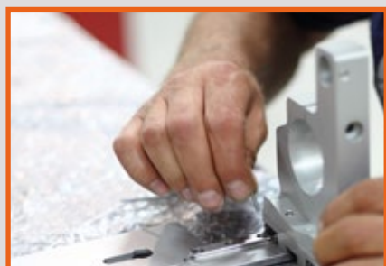
A melhor qualidade

Temos o prazer de fornecer aconselhamento individual sobre nossos produtos, bem como sobre os temas de financiamento, subsídios, planejamento do local de trabalho, peças moldadas, etc.