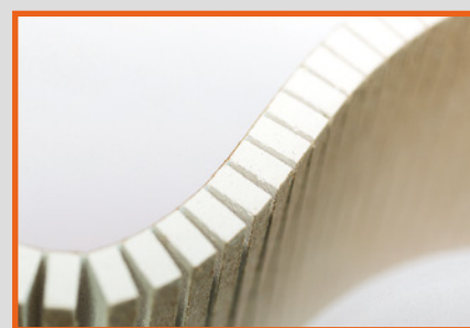
Pezzi stampati tridimensionali