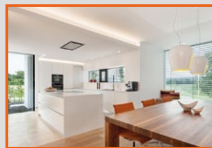
I migliori risultati di design