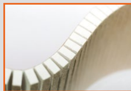
Pezzi stampati tridimensionali