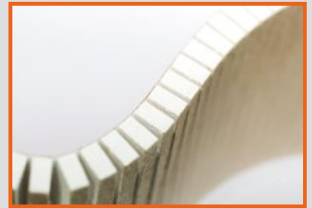
Piezas moldeadas tridimensionales