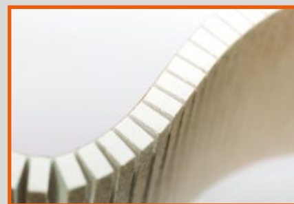
Pezzi stampati tridimensionali