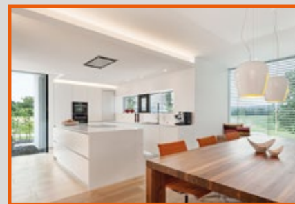
I migliori risultati di design