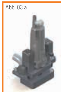
Abb. 03 a