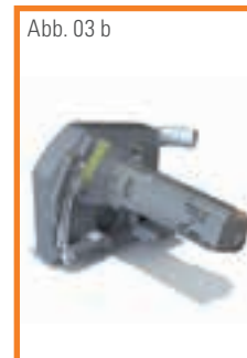
Abb. 03 b