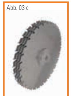
Abb. 03 c