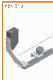
Abb. 04 a