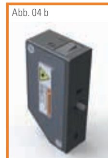
Abb. 04 b